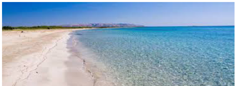
Spiaggia di Donnalucata

Primo giorno La località presa in considerazione è uno dei litorali più belli ed affascinanti della costa siciliana. La facilità di accesso e di percorrenza rendono particolarmente accessibili questi posti anche a tutti coloro che desiderano avere un approccio non impegnativo pur desiderando momenti di relax e benessere. Ecco perché rappresenta il giusto momento per tutti quei bikers che desiderano praticare la loro amata passione in MtB senza rinunciare ai loro affetti, mogli, figli, etc che avranno la possibilità di vivere la propria vacanza anche in modo autonomo ed indipendente. La location per trascorrere la notte è una villetta, di proprietà di un'amica e socia, destinata a casa vacanza, distante qualche centinaio di metri dal paese e collegata da una stradina interna privata alla spiaggia. Luogo destinato all'appuntamento è il paesino di Donnalucata, e precisamente il porto adiacente. Per raggiungere Donnalucata da Ct bisogna imboccare la tangenziale e da lì proseguire per Siracusa. Continuare sempre sull'autostrada fino all'ultimo