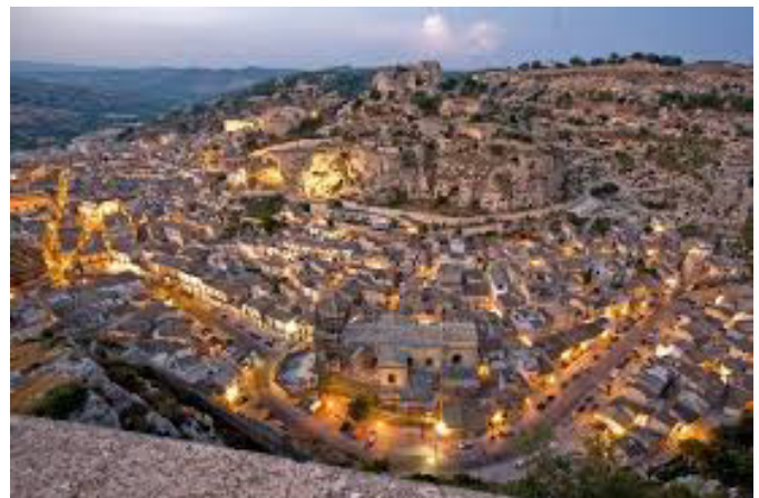
Scicli di notte