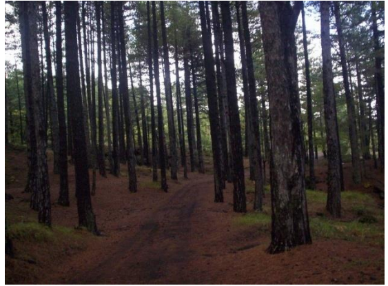
Scorcio della Pineta di Biancavilla

Gualberto. Dopo inizierà la parte sterrata. Ci dirigeremo in direzione nord-ovest verso il Rifugio Galvarina attraverso zone boschive alternate a vecchie colate laviche fino a scorgere sulla nostra sinistra Monte Vituddi (nome che deriva dalla presenza di qualche esemplare di Betulla nei pressi) e quindi il rifugio anzidetto. Fatta una breve sosta, lasceremo l'Altomontana prendendo il bivio a sinistra e procedendo in discesa fino alla successiva biforcazione prendendo anche qui a sinistra. Continuando ancora in discesa si raggiunge un ulteriore bivio. Da qui si prende a sinistra la carrareccia che si dirige verso sud-est e che passa a valle di Monte Fontanelle. Il primo tratto è panoramico sulla zona sud dell'Etna, ci conduce tra colate e parti boschive fino ad addentrarci nella Pineta di Biancavilla caratterizzata da pini larici d'alto fusto per arrivare nei pressi di un rifugio forestale conosciuto come Casa Biancavilla o Casa